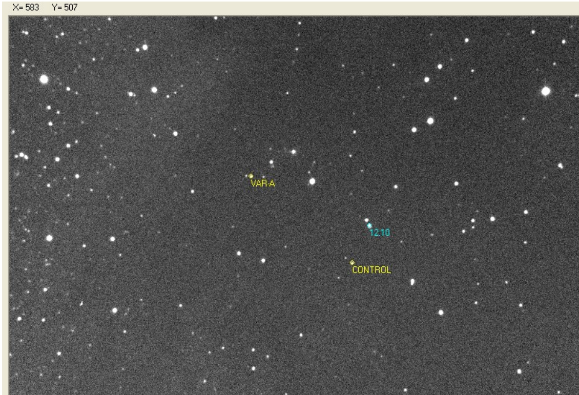
Campo de la estrella LkHA 188G4

Para alcanzar una precisión de 0,02 magnitud se necesita conseguir una SNR de 100 o mayor.