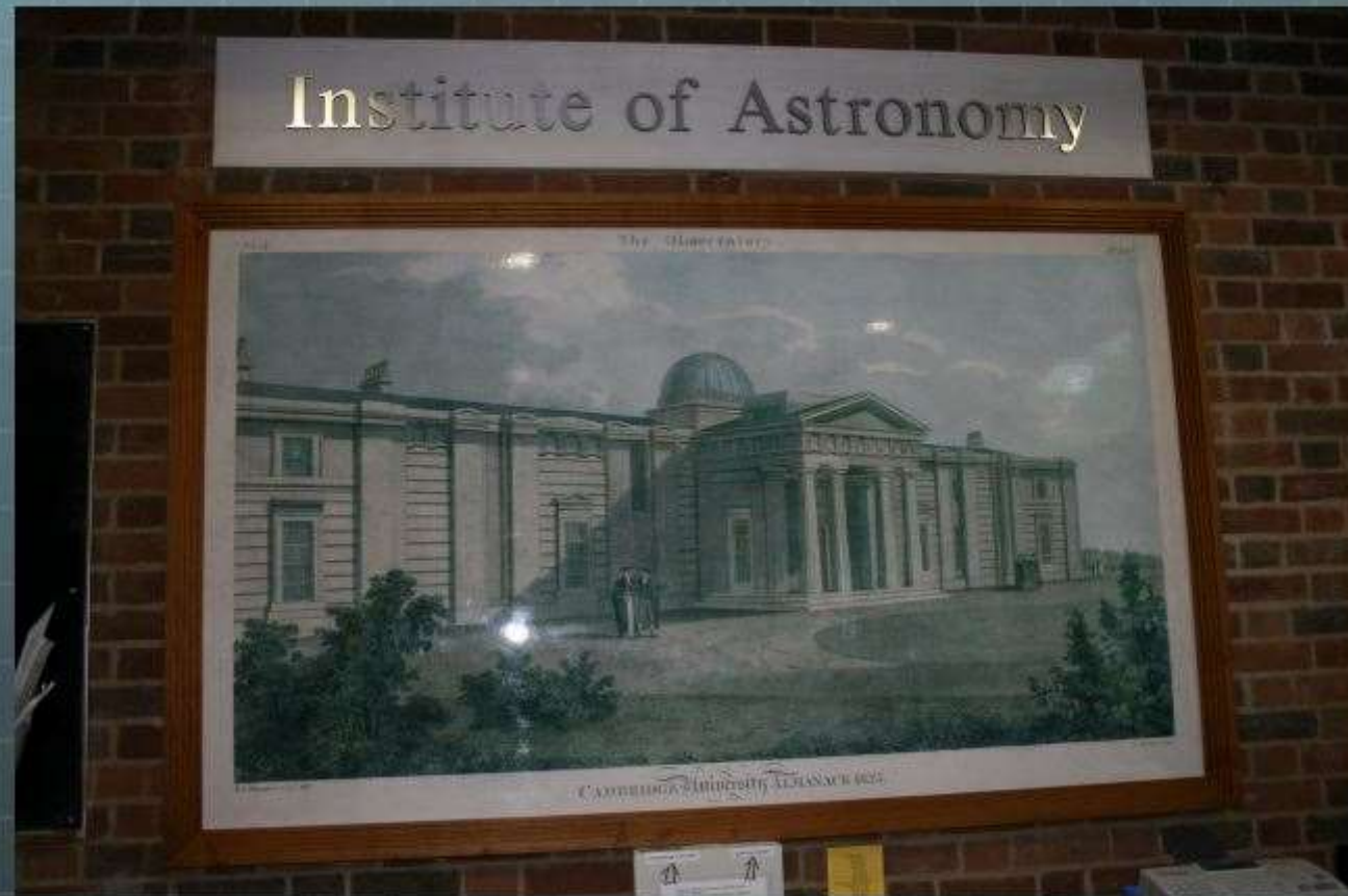
Gravure de l'Institut d'Astronomie de Cambridge