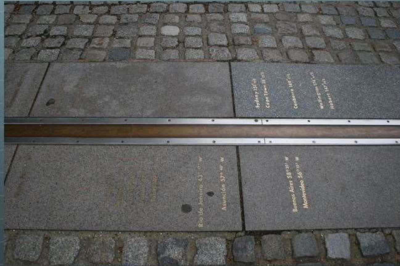
La ligne de la Longitude zéro