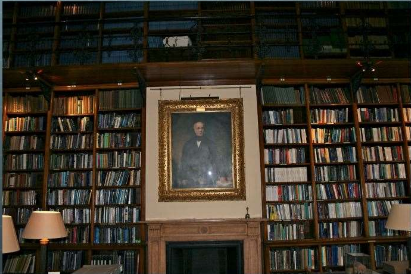
La bibliothèque de la Royal Astronomical Society