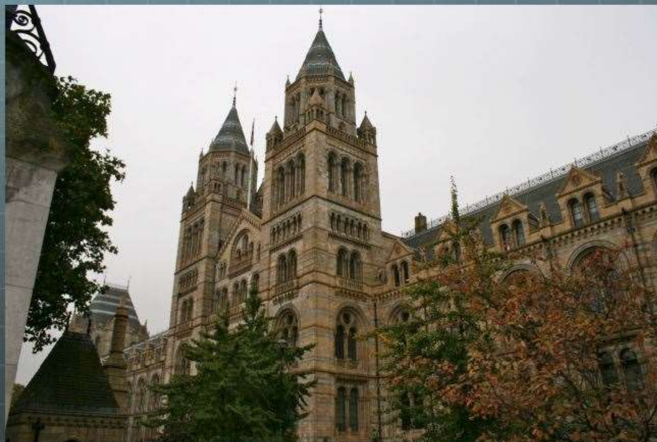
La façade du musée des sciences de Londres