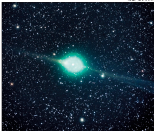
► El Lulin, visto desde un observatorio aficionado de Arizona.